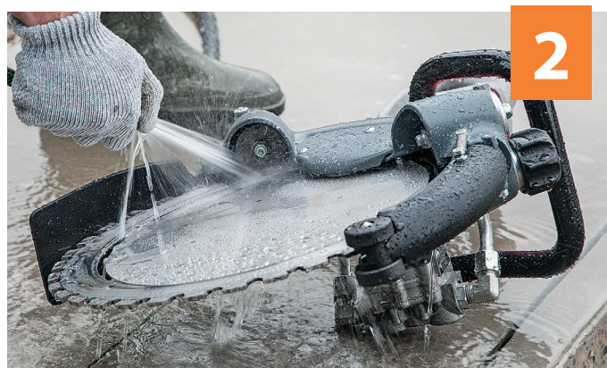
2 Rengjør valsene og huset veldig nøye med vannslange hver gang etter endt bruk...