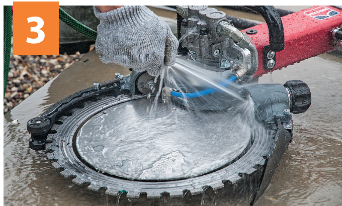
3 ... på begge sider