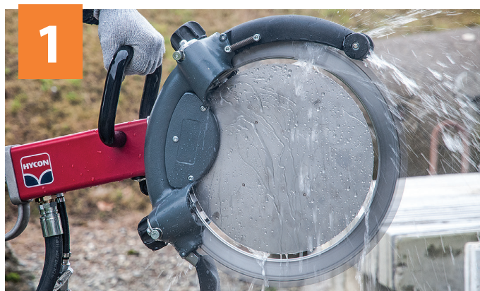
1 La ringbladet spinne fritt for minimum 30 sekunder etter hver jobb. Rent vann vil da skylle rullene.