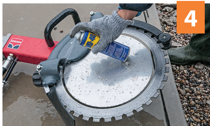
4 Til slutt spray alle deler med WD-40.