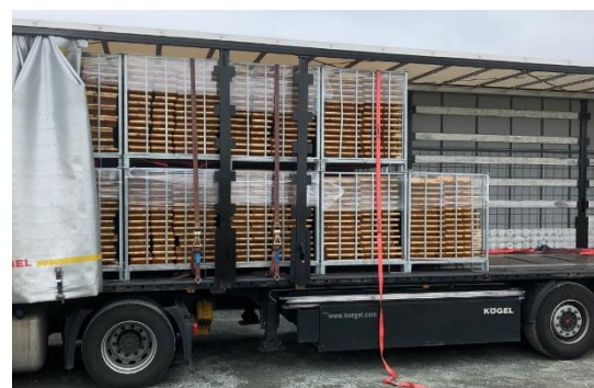
Fig 4. Lastet på bil