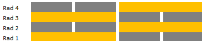
Fig 2. Stabling sett fra kortsiden på barrelle.