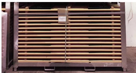
Fig 3. Full barrelle med benk og bordsett